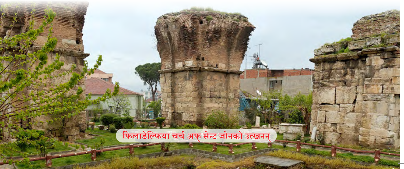
फिलाडेल्फिया चर्च अफ् सेन्ट जोनको उत्खनन्

१८ हाम्रा प्रभु येशू ख्रीष्टको अनुग्रह तिमीहरू सबैमाथि होस्।