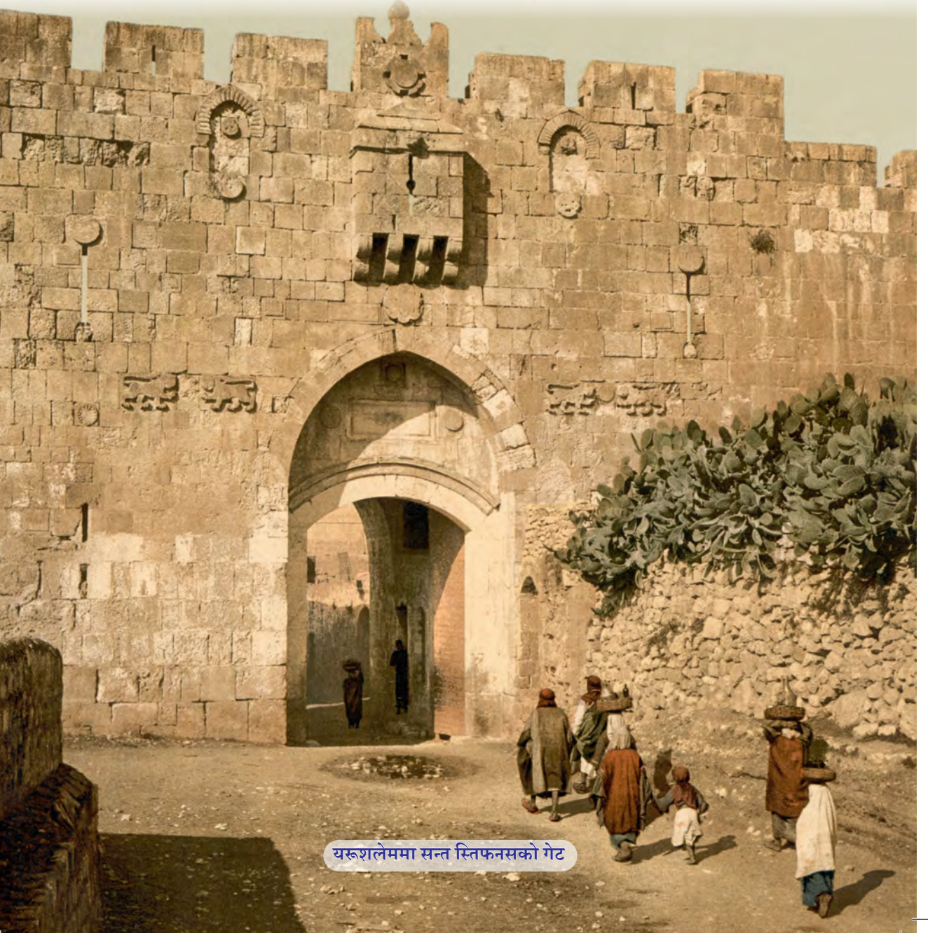
यरूशलेममा सन्त स्तिफनसको गेट

जानेका छौ। यसर्थ होशियार बन। ती दुष्ट मानिसहरूलाई, तिनीहरूलाई भूल शिक्षातिर लान नदेऊ। सावधान बन, जसद्वारा तिमीहरू आफ्ना दृढ स्थितिबाट झर्ने छैनौ। १८ तर हाभ्रा प्रभु अनि उद्धारकर्ता येशू ख्रीष्टको अनुग्रह अनि ज्ञानमा अघि बढ। अहिले अनि सधैंको निमित्त उहाँमा महिमा रहोस्। आमिन्।