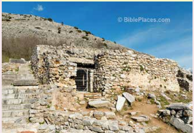
फिलिप्पी में पौलुस का परम्परागत बन्दीगृह

फिलिप्पी: एजीयन सागर से नौ मील दूर स्थित एक समृद्ध नगर, जो यूरोप में पहली बार सुसमाचार पहुँचने के स्थान के तौर पर विख्यात है